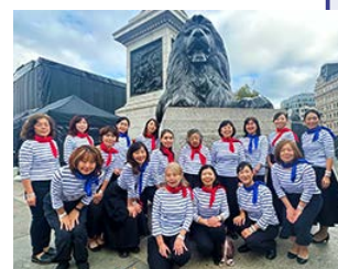
ジャパン祭りでの集合写真

Facebook: @GreenChorusLondon Instagram: @greenchoruslondon