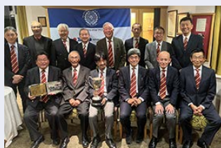
勝利を取めた日本クラブチーム

昨年10月20日、「クリサンシマム杯」がメイドンヘッド・ゴルフ場で開催されました。この大会は、日本クラブと英国のメイドンヘッドGC (Maidenhead Golf Club) が毎年行う伝統的な日英親善対抗戦で、今回は100周年第90回を数える記念すべき大会でした。