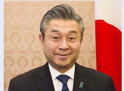
鈴木 浩 駐英国日本国大使

は新国立劇場バレエ団のロンドン公演、8～9月にはイングランドでの女子ラグビーワールドカップへの日本代表出場、10月には大相撲のロン